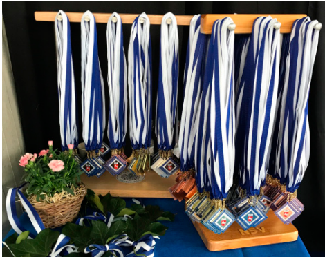
...wollen wir haben