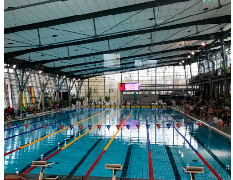
...eine sehr schöne Halle

Am Samstag ging es dann mehr oder weniger nach Richtung Sportbad Heidberg, damit wir pünktlich um 8 Uhr morgens (!!!) zum Einschwimmen ins Becken kamen. Wie so oft ging gleich nach Toresöffnung der Run auf die Schrän-