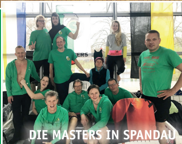
DIE MASTERS IN SPANDAU