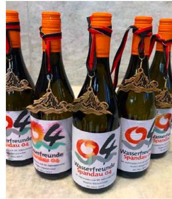
Unsere Ausbeute :)

eine überaus harmonische Truppe am Start. Es war definitiv kein verschenkter Samstag. Mit vielen Urkunden, Medaillen und 5 (!!) Prosecco Flaschen schlossen wir diese Sportveranstaltung positiv für uns ab. Das lässt auf erfolgreiche NDM hoffen!