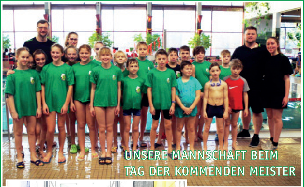
UNSERE MANNSCHAFT BEIM TAG DER KOMMENDEN MEISTER